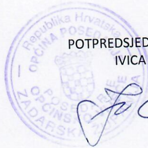
POTPREDSJEDNIK OPĆINSKOG VIJEĆA IVICA ZURAK

Ova Odluka objavit će se u „Službenom glasniku Općine Posedarje“, a stupa na snagu od 01. siječnja 2020. godine.