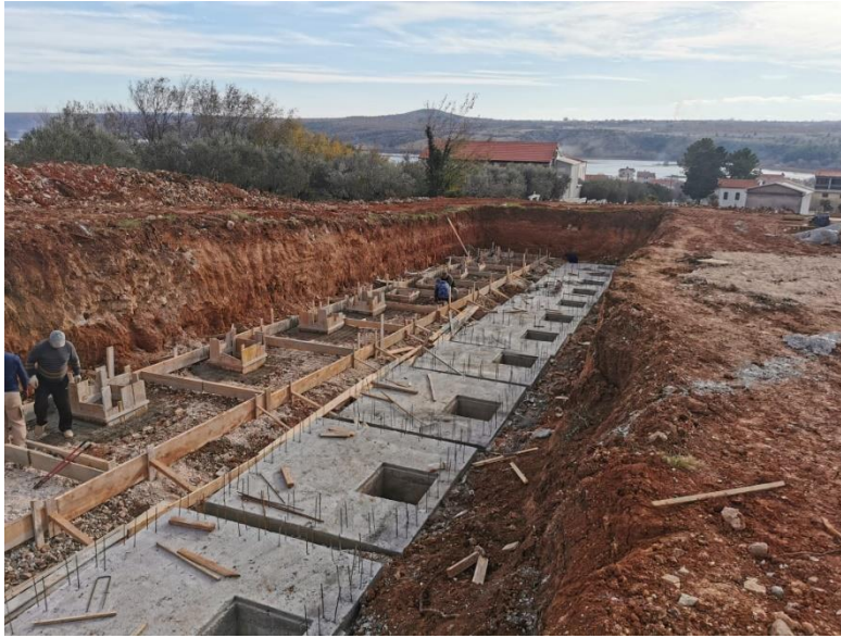
Groblje u Posedarju