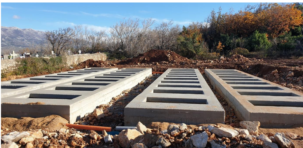
Groblje u Vinjeru